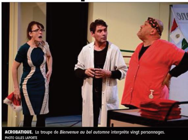
ACROBATIQUE. La troupe de Bienvenue au bel automne interprète vingt personnages.

La dramaturge de la compagnie Cavalcade, de son propre aveu, « vit, mange et dort avec ce texte » depuis dix-huit mois. Après une longue préparation et une interruption due à la pandémie de coronavirus, la comédienne et sa troupe sont prêts à présenter la grande première de la pièce au pu-