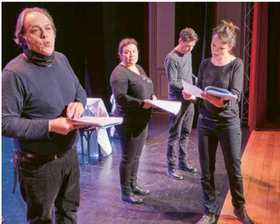
Les comédiens de la compagnie Cavalcade lors de la captation de la lecture de Bienvenue au Bel Automne en décembre au Théâtre