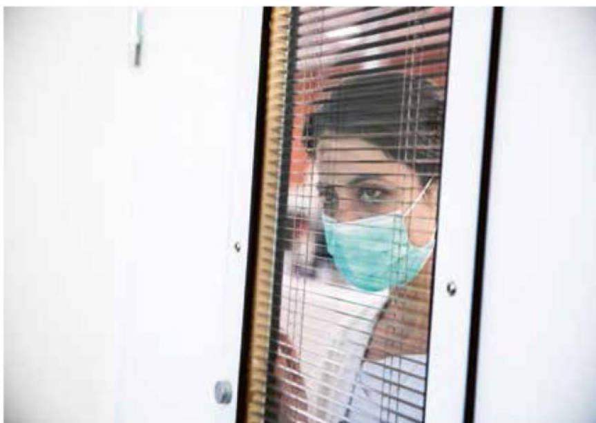
| Une photo extraite de « 24 heures en réa »